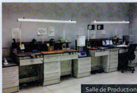
Salle de Production