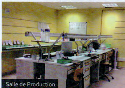
Salle de Production

Grâce à l'engagement et l'expertise de l'équipe et à ces outils numériques de pointe, LMP - Laboratoire Mondial Prothèse fabrique des produits de prothèse dentaire de grande qualité. Le certificat de traçabilité, remis avec le produit, permet de s'assurer du respect des différentes exigences et normes mises en place par le laboratoire. On retrouve ainsi au catalogue de LMP leurs différentes gammes (à retrouver sur le site).