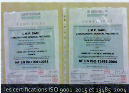
les certifications ISO 9001 2015 et 13485 2004

une rapidité d'exécution et de livraison. Ces outils de haute technologie sont accompagnés par des techniciens formés et qualifiés dont l'expérience et l'expertise sont irremplaçables. Leur disponibilité et leur écoute permettent de garantir des produits conformes à la demande des praticiens, avec une traçabilité à tous les niveaux de la production, et de répondre à leurs exigences, se rappelant constamment qu'ils travaillent pour la santé des patients. L'ambition de l'équipe de LMP - Laboratoire Mondial Prothèse, au fil des ans, demeure, avant tout, la satisfaction client. Une satisfaction sans cesse constatée grâce à un engagement de qualité qui se vérifie au niveau des certifications que LMP - Laboratoire Mondial Prothèse a obtenues. Des audits réguliers garantissent que leurs engagements sont respectés, et souvent aboutissent à de nouvelles pistes de réflexion.