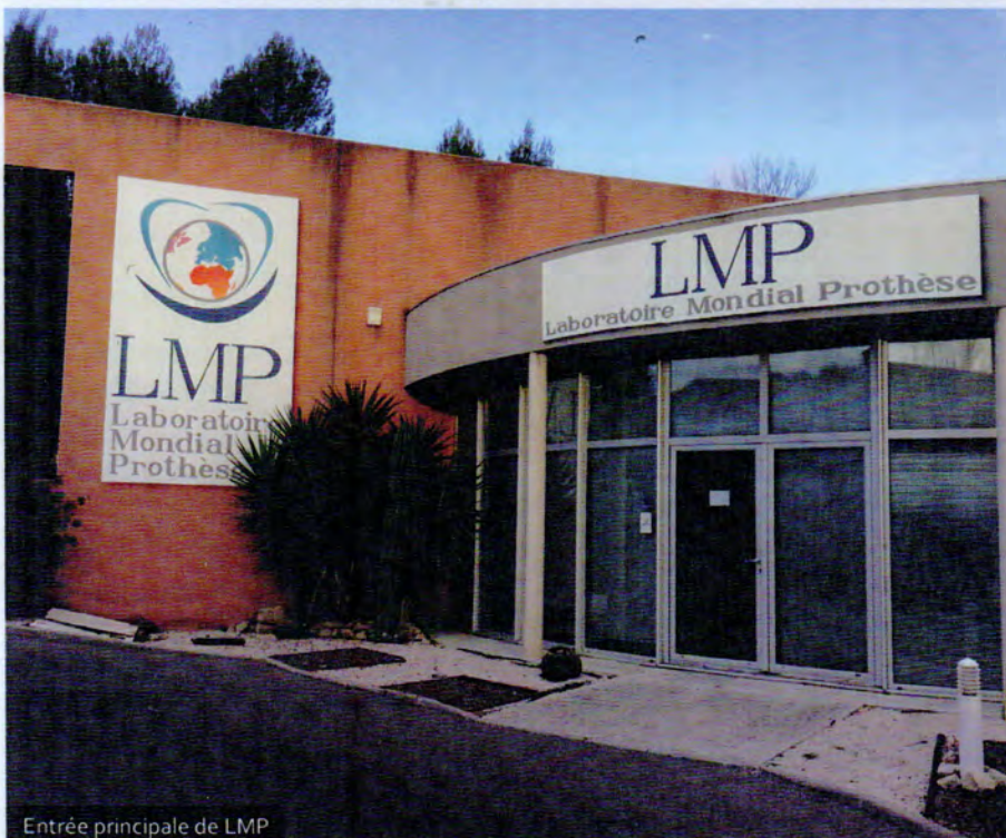
Entrée principale de LMP